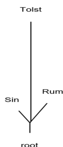
Рис. 2. Степень близости списков по критерию совпадения/несовпадения текстовых фрагментов

Сопоставление по критерию присутствия/отсутствия/полноты текстовых фрагментов по спискам ОП показало удаленность Толст и от Син , и от Рум . Графически это выглядит так: