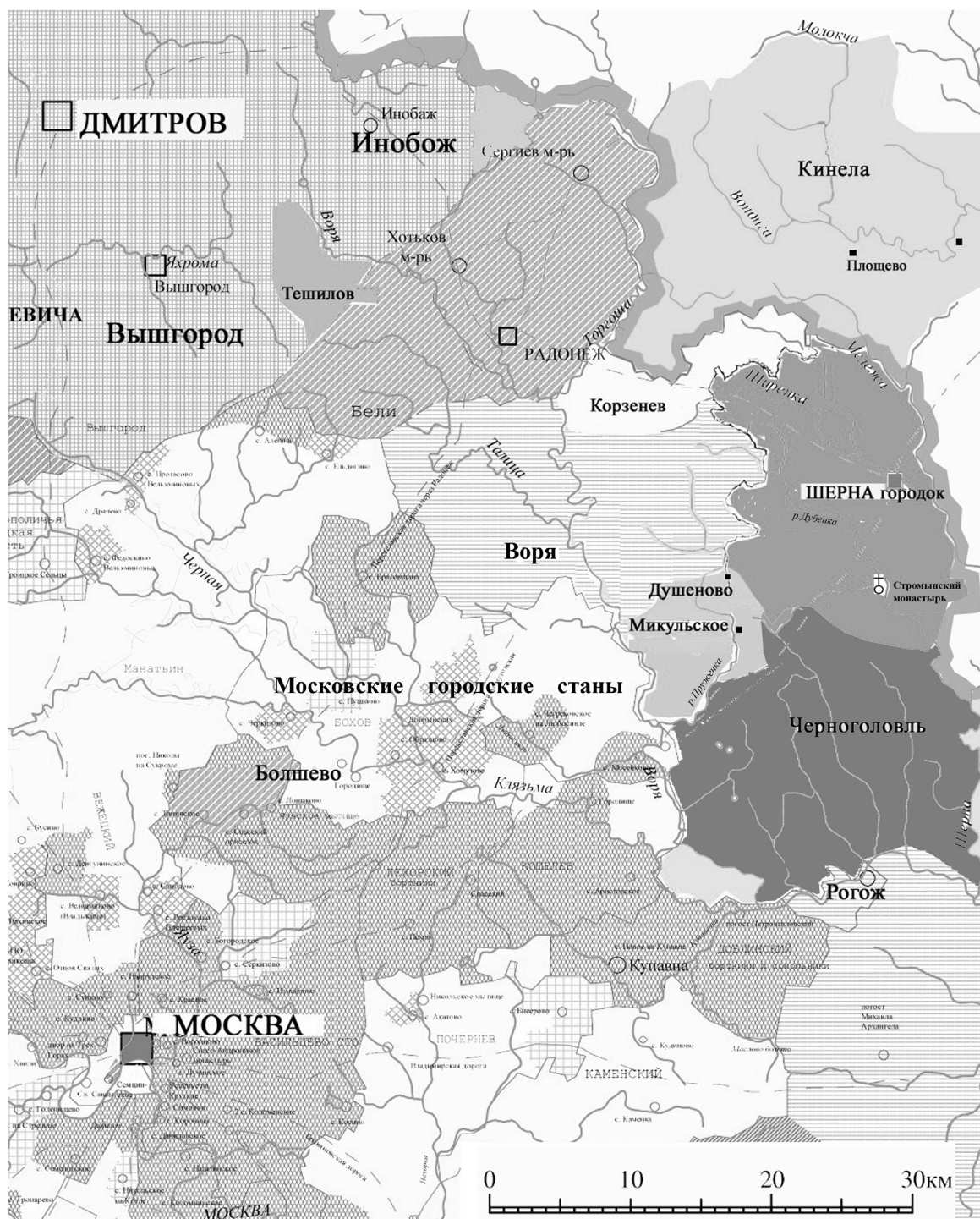
Рис. 1. Северо-восток Московского княжества. Схема расположения волости Воря