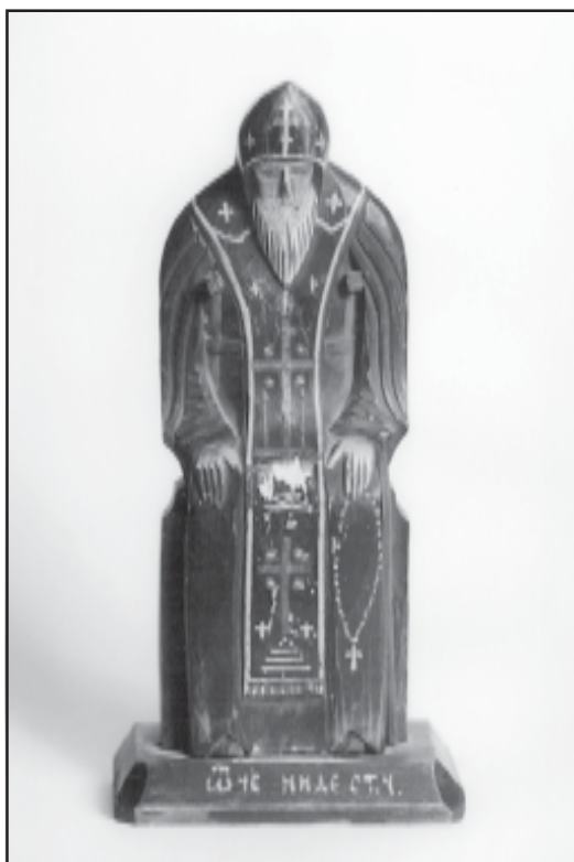
Преподобный Нил Столобенский. Аскет. № В. 045. XIX век. Н. 22,0 x 10,5 см. Резьба по дереву, роспись.