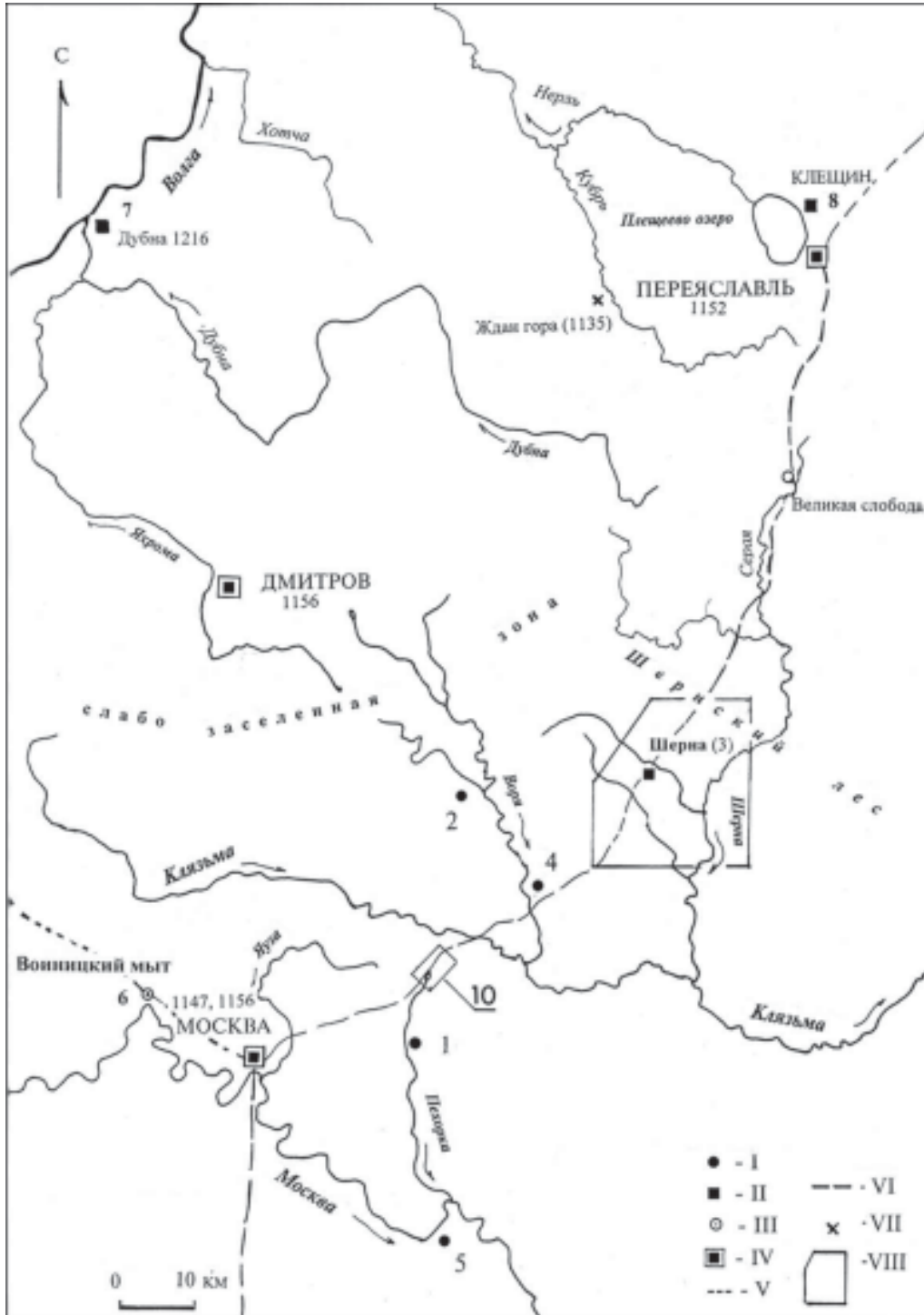
Рис. 1. Шерна-городок в системе укрепленных поселений западной части Владимиро-Суздальского княжества второй половины XII—XIII в. Схема I — убежища XIII—первой четверти XIV в.; II — городки XII—XIII в.; III — открытое поселение XII—XIII в.; IV — города второй половины XII—XIII в.; V — участок дороги из Волока Ламского к Москве; VI — участок дороги из Киева в Ростов (между Переяславлем и Москвой); VII — место битвы на Ждане горе (1135 г.); VIII — район Шерны-городка (Рис. 5); 1 — Никольское Мытищи (археологический комплекс у Балашихинского городища в урочище «Лисья гора»); 2 — Воря (археологический комплекс городища Царево-1); 3 — городок Шерна (археологический комплекс городища у д.Могутово); 4 — археологический комплекс Громковского городища; 5 — Воскресение у Боровского перевоза (археологический комплекс у городища Боровский курган) 6 — Воиницкий мыт у Спаса на Востоке (археологический комплекс в районе 1-го Спас-Тушинского городища); 7 — Дубна (поселение у с. Ратмино); 8 — городище у с. Городище (Клещин); 9 — центр переславской волости Великая слобода (XV в.), маркирующий зону освоения XII—XIII в.; 10 — место «старой Переславской лесной дороги», упоминаемой в меновой грамоте Дмитрия Донского на земли Спасской пустыни на Медвеьем озере (1381—1383 г.).