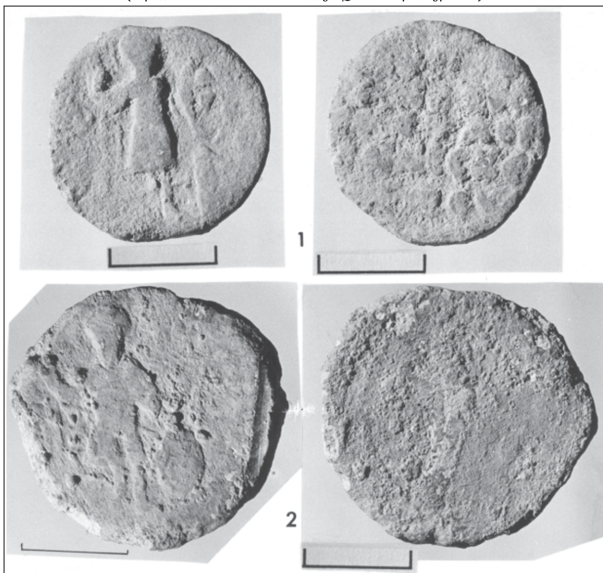
Таблица 1. Свинцовые печати, найденные в 2001 г. на селище Могутово-2.

(Продолжение статьи в следующем номере журнала)