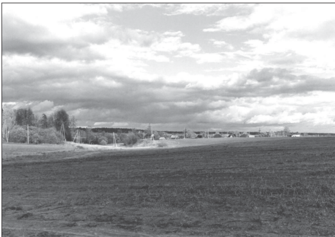
Рис. 3. Могутовское городище. Вид с юго-востока, из-за ручья, от места нахождения вислых свинцовых печатей и пломб (вверху). Селище Могутово-2 (освещенный солнцем участок поля перед деревней), на котором были найдены печати и пломбы. Вид с юго-запада (внизу). 6.10.2001 г.