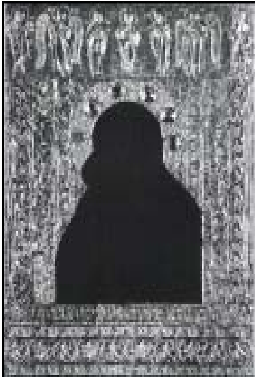
Илл. 5. Богоматерь Владимирская. Оклад иконы 1395 г.