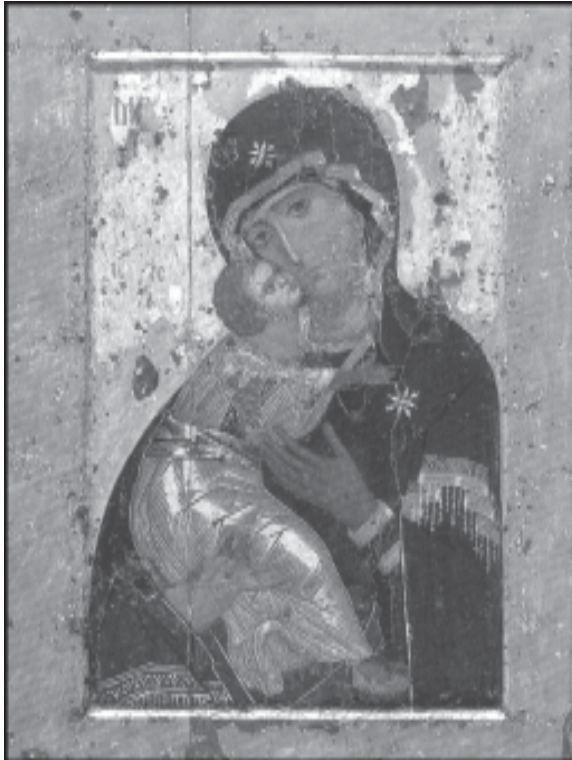
Илл. 1. Богоматерь Владимирская XII века.