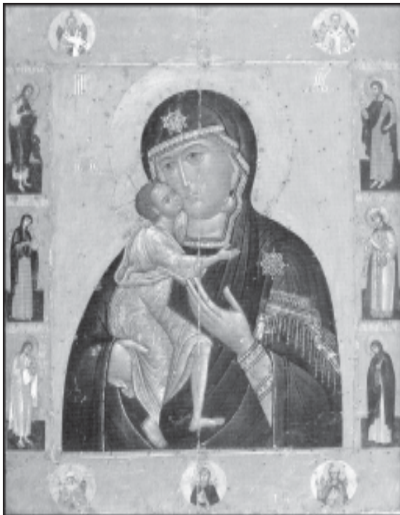
Илл. 8. Богоматерь Владимирская с праздниками и святыми («Запасная»)