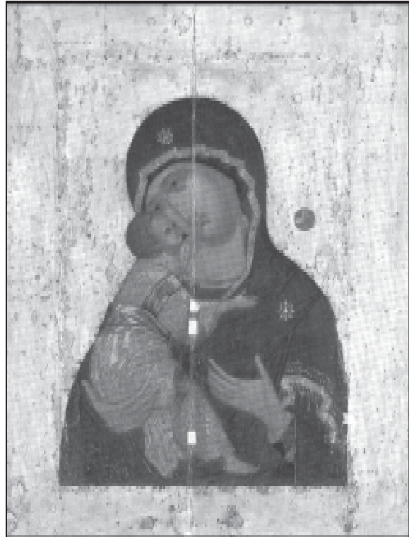
Илл. 2. Богоматерь Владимирская. Около 1395 г.