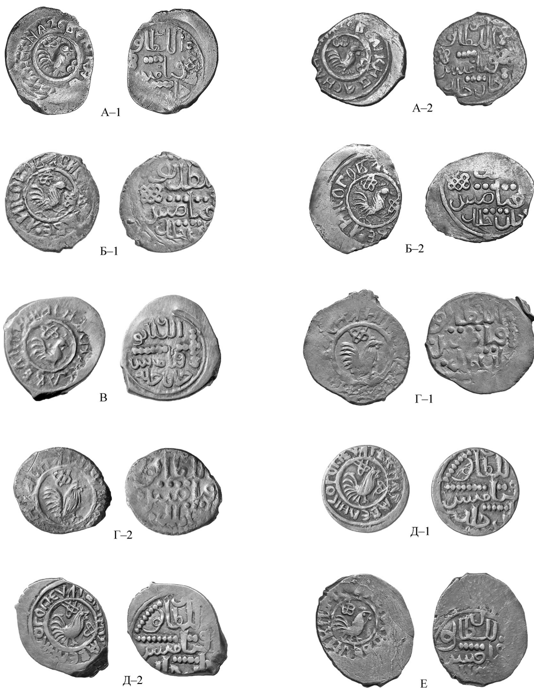
Рис. 3. Фото денег Василия Дмитриевича с изображением петуха, связанных общими штемпелями оборотной стороны с полуденгами. А-1, А-2 – с полуденгами варианта 1; Б-1, Б-2 – с полуденгами варианта 2; В – с полуденгами вариантов 3 и 4; Г-1, Г-2 – с полуденгами варианта 5; Д-1, Д-2 – с полуденгами варианта 6; Е – с полуденгой варианта 10.