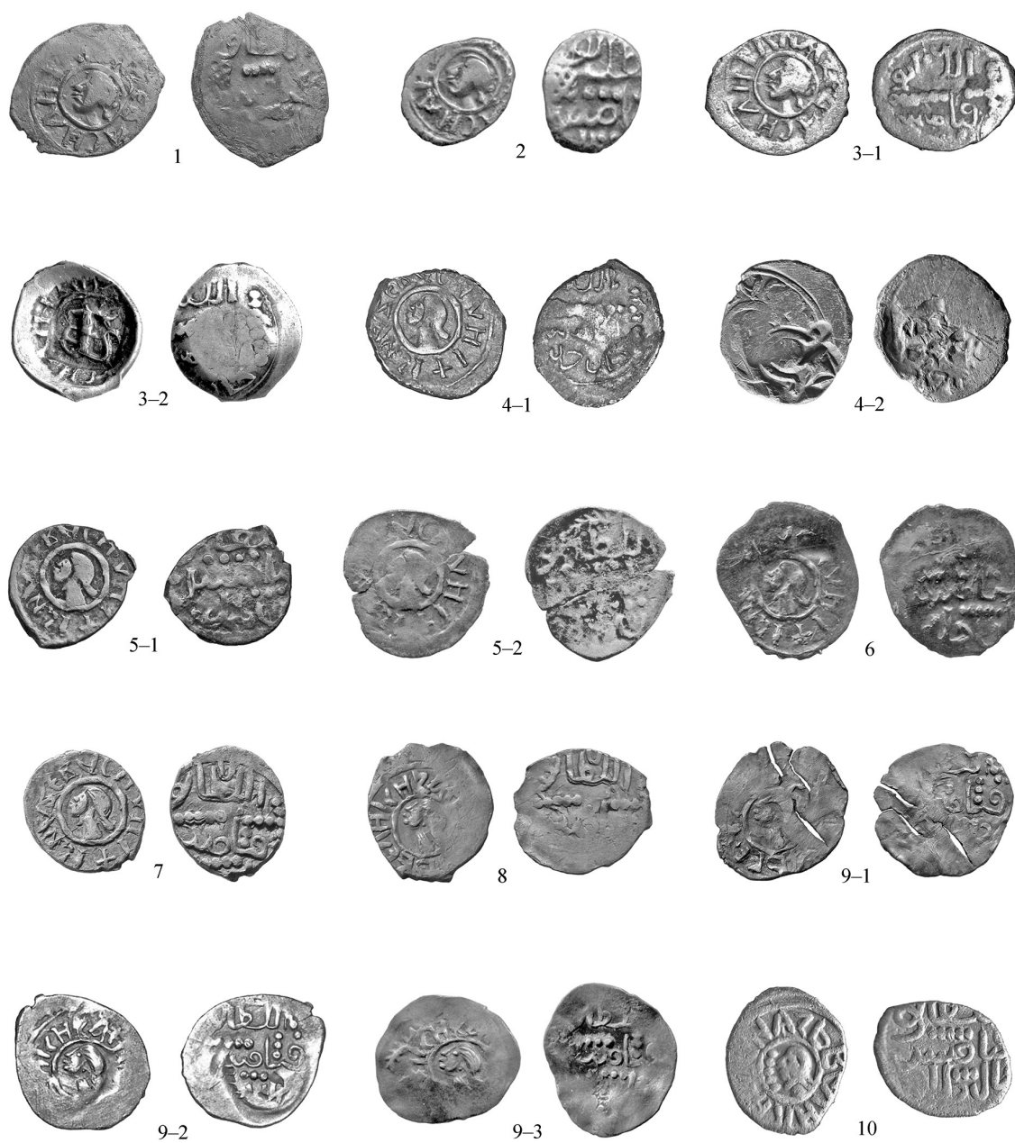
Рис. 2. Фото полуденег Василия Дмитриевича с изображением головы человека. 1 – полуденьга варианта 1; 2 – полуденьга варианта 2; 3-1, 3-2 (с надчеканкой) – полуденьги варианта 3; 4-1, 4-2 (с двумя надчеканками) – полуденьги варианта 4; 5-1, 5-2 (со следами перечеканки) – полуденьги варианта 5; 6 – полуденьга варианта 6; 7 – полуденьга варианта 7; 8 – полуденьга варианта 8; 9-1, 9-2, 9-3 (все со следами перечеканки) – полуденьги варианта 9; 10 – полуденьга варианта 10.