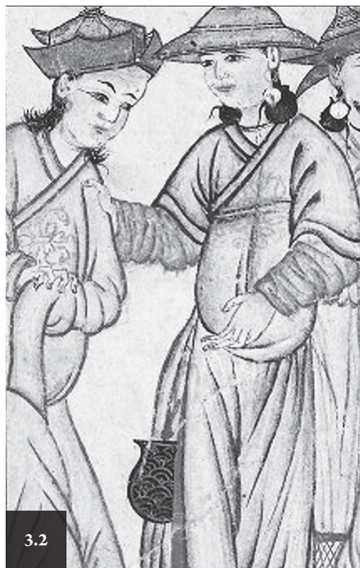
Рис. 3.2. Сумки на поясах придворных. Малик-Хан. Миниатюра из книги Рашид ад Дина «Джами ат-Таварих» начала XIV в. Фрагмент.