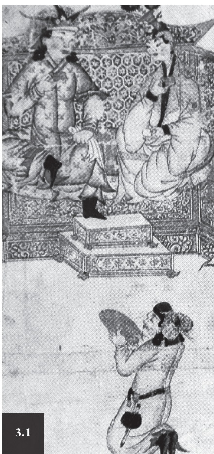
Рис. 3.1. Сумка на поясе придворного. Газан-Хан с женой и придворными. Миниатюра из книги Рашид ад Дина «Джами ат-Таварих» начала XIV в. Фрагмент.