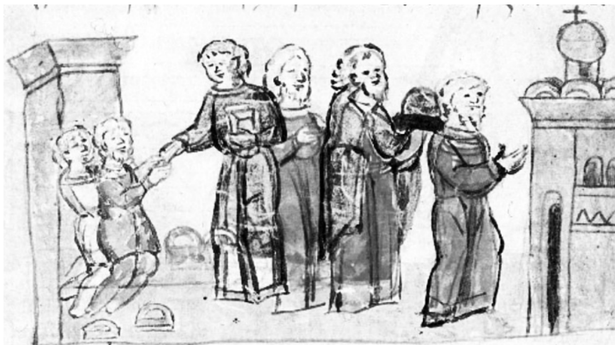
Рис. 6. Миниатюра Радзивилловской летописи. Л. 69 об.