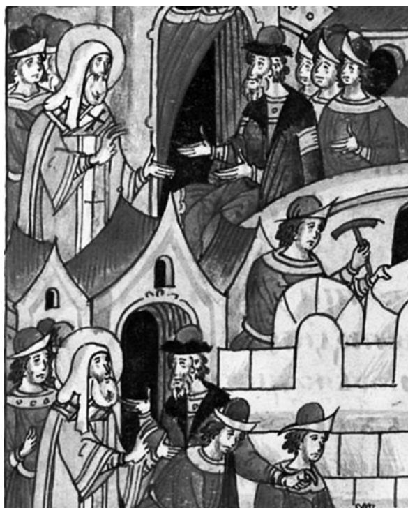
Рис. 1. Князь Иван Данилович на миниатюре Остермановского тома Лицевого летописного свода // НИОР БАН. 31.7.30. Л. 183. Фрагмент.

Подводя итог сказанному выше, предлагаем в качестве гипотезы считать, что великий князь Иван Данилович получил свое прозвище потому, что, помимо своей сильной и глубокой склонности к благотворительности, наверное, присущей не только ему, но и другим правоверным христианам, он запомнился тем, что в то время, как все люди (и в Европе, и в Азии) носили на своих поясах, что подтверждается разными достоверными источниками, только одну сумку, в которой держали и деньги, и бытовые предметы, он носил на поясе еще одну, вторую , сумку, специально для раздачи милостыни, что происходило на глазах у всех и было очень необычно, а следовательно, запомнилось свидетелями и зафиксировалось в народном сознании 18 (Рис. 7).