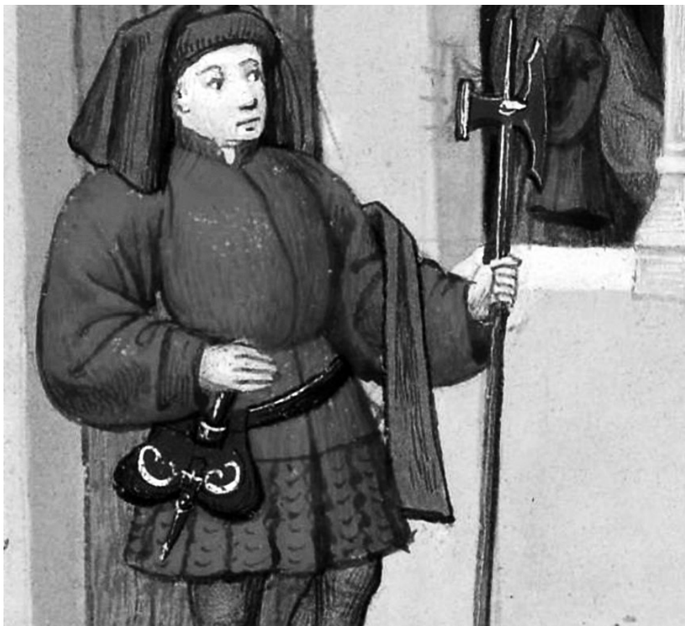
Рис. 5.3. Декамерон. 1401–1500 гг. // Bibliothèque de l'Arsenal. Ms-5070. F. 116r. Фрагмент.