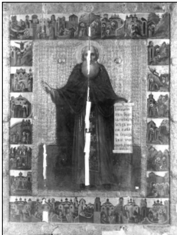
Икона. Александр Свирский, в житии. Вторая половина XVI в. Государственный Русский музей.