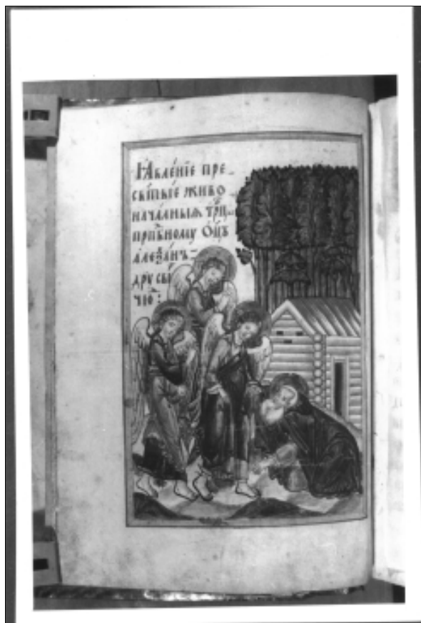
Фронтиспис жития Александра Свирского 1715 г. Явление Троицы Александру Свирскому Государственный Русский музей.