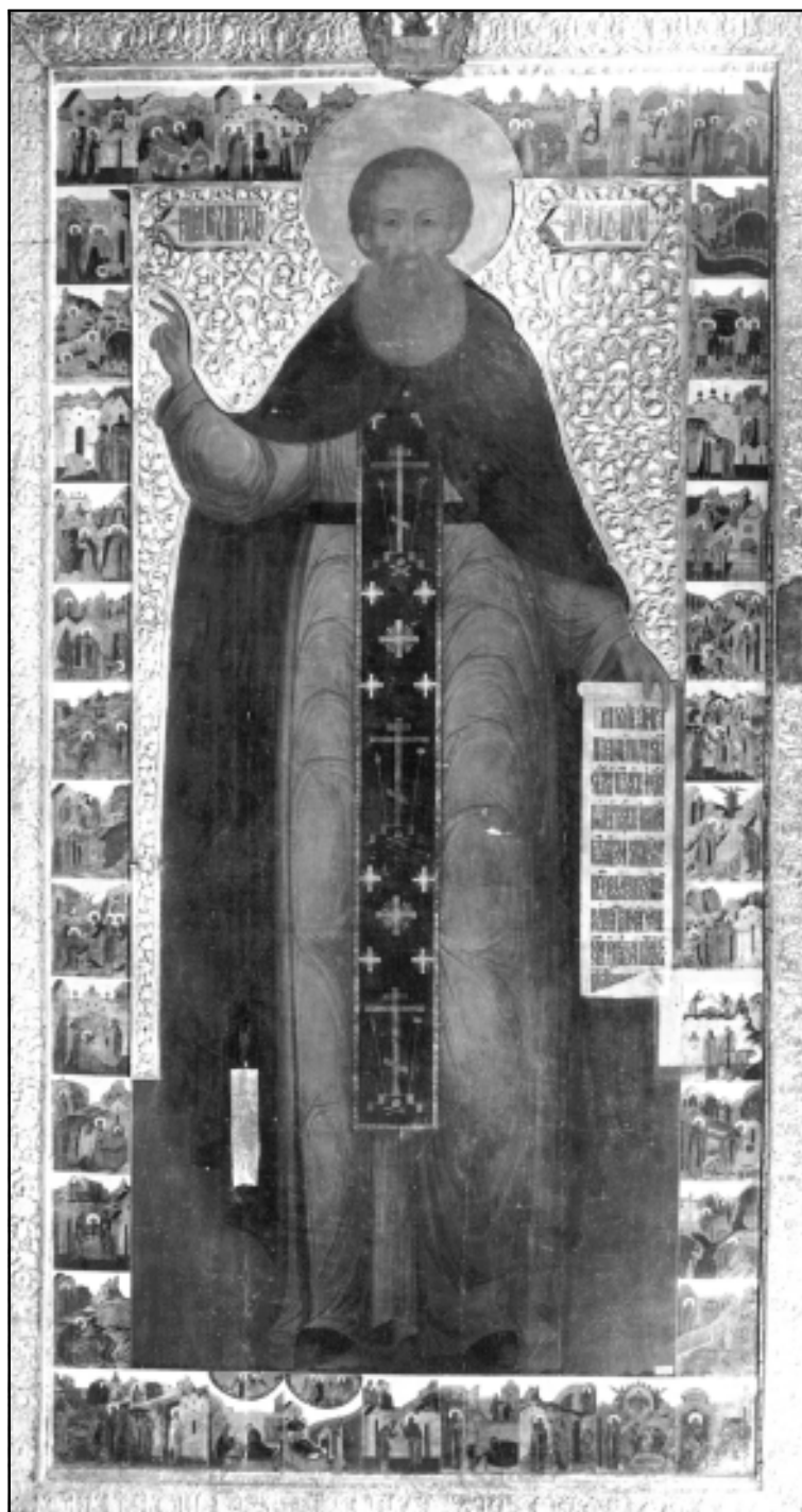
Икона. Александр Свирский, в житии. 1655 г. Государственный Русский музей.