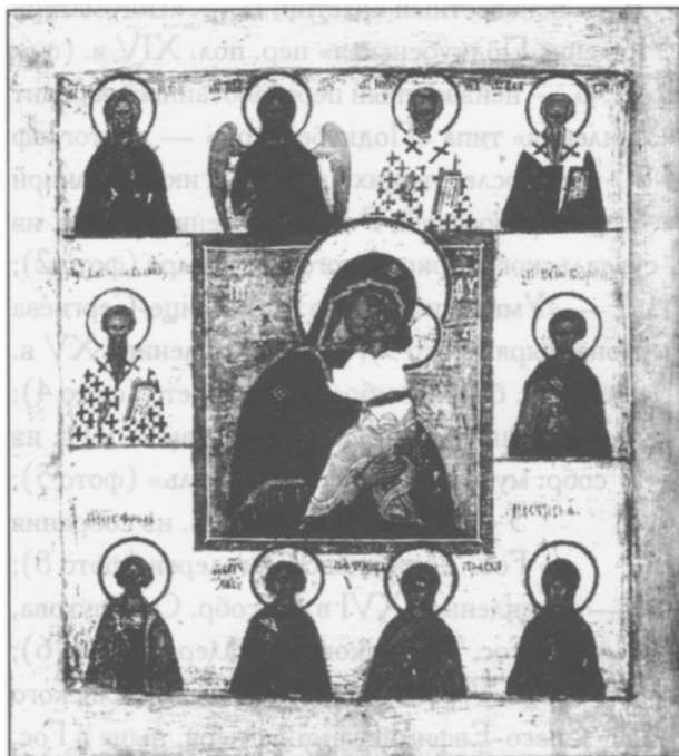
Фото 8. «Богоматерь Умилении Подкубенская», XVI в. Гос. Третьяковская галерея.