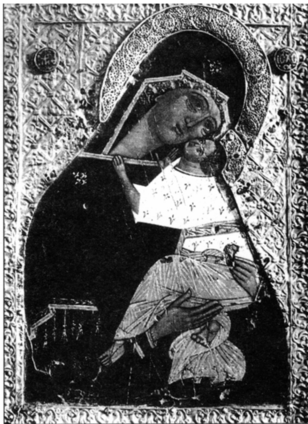
Фото 3. «Богоматерь Умиление Подкубенская», XV в. Сергиево-Посадский музей-заповедник.