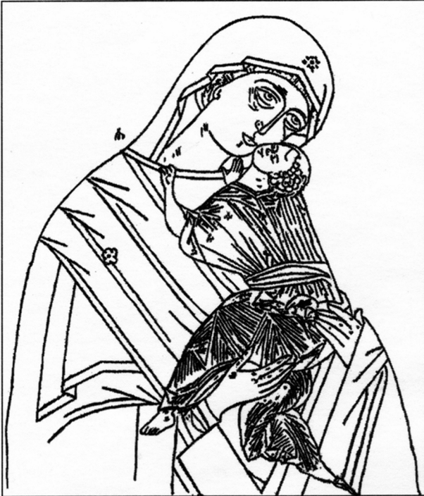
Рис 1. Прорись с иконы XVI в. «Богоматерь Умиление Подкубенская» из кн.: Кондаков Н. П. Иконография Богоматери. Связи греческой и русской иконописи с итальянской живописью раннего Возрождения. СПб., 1911. С. 174.