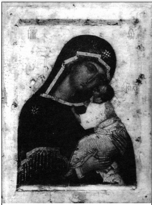
Фото 7. «Богоматерь Умилении Подкубенская», XVI в. Гос. Русский музей.