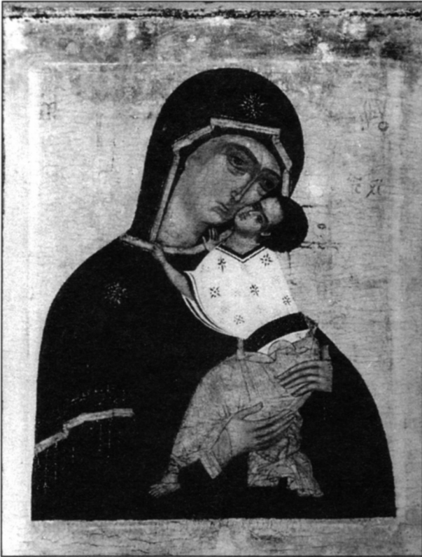
Фото 5. «Богоматерь Умиление Подкубенская», конец XV — начало XVI в. Гос. музей- заповедник «Ростовский кремль».