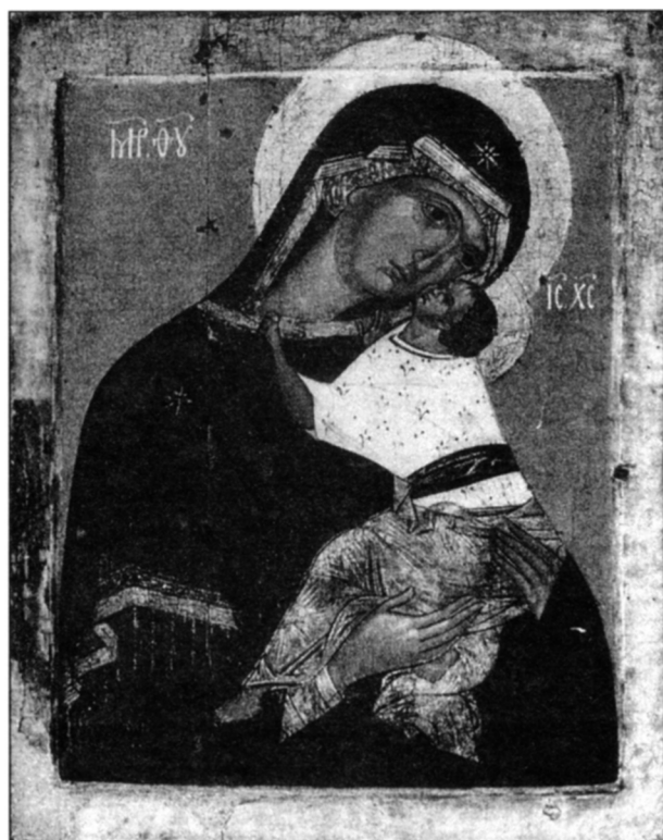
Фото 4. «Богоматерь Умиление Подкубенская», XV в. Собрание итальянского банка Амброзиано Венето.