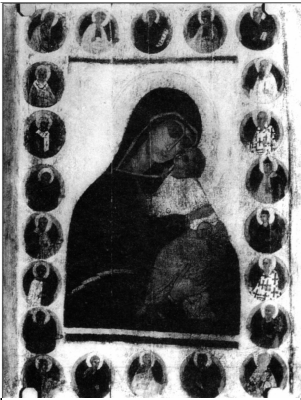
Фото 2. «Богоматерь Умиление Подкубенская», XV в. Владимиро-Суздальский музей- заповедник.