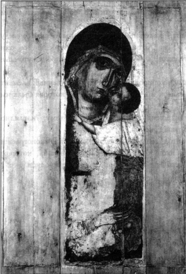
Фото 1. «Богоматерь Умиление Подкубенская», первая половина XIV в. Вологодский областной краеведческий музей.