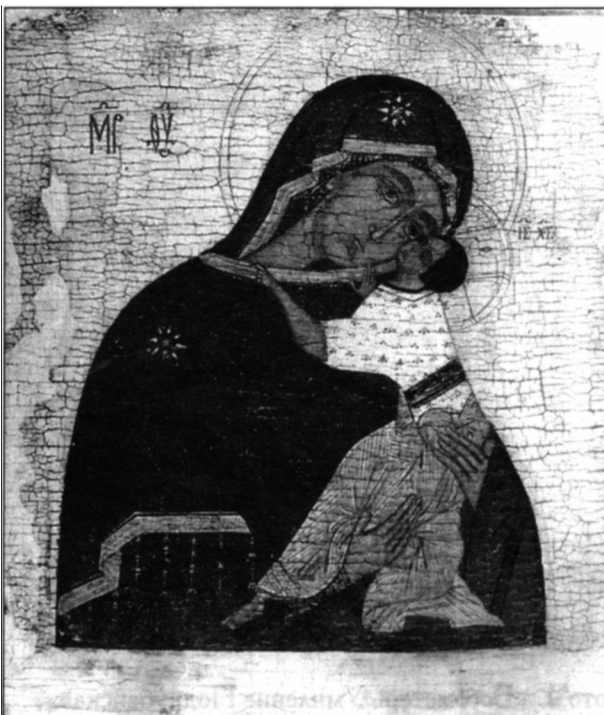
Фото 6. «Богоматерь Умиление Подкубенская», XVI в. Гос. Третьяковская галерея.